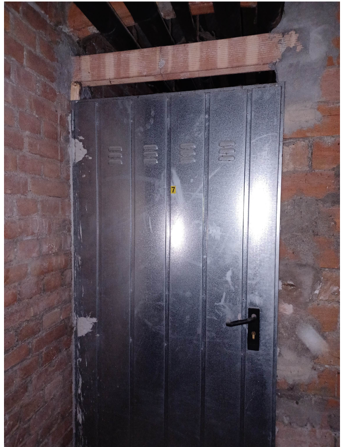
Porta locale cantina n.7