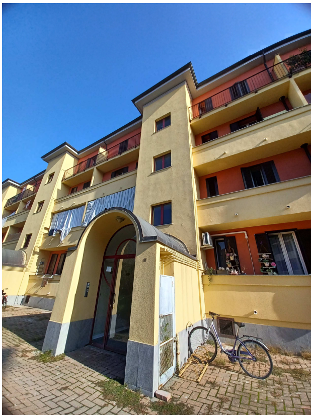
Foto esterna dell'edificio