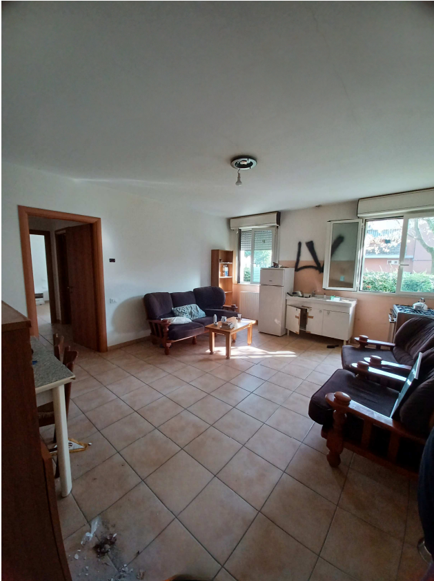
Locale cucina e zona giorno